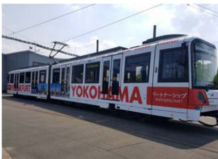
「横浜ーフランクフルトパートナー都市号」