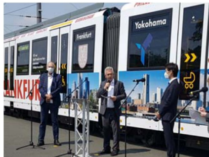
オープニングセレモニーの様子 (左からフランクフルト交通公社CEO、フランクフルト市長、横浜市フランクフルト事務所長)