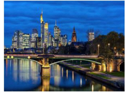
フランクフルト中心部