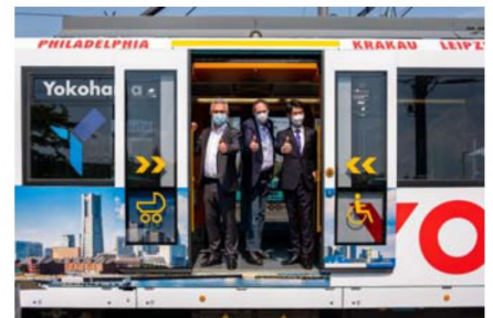
左からフランクフルト市長、フランクフルト交通公社CEO、横浜市フランクフルト事務所長